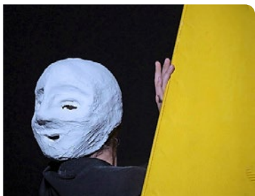
Aufführung: «Maske und du».

Das zeitgenössische Tanzfestival Tanz Plan Ost kann trotz Pandemie noch bis zum 10. Dezember stattfinden und wird an jedem der acht Spielorte (Zürich, Winterthur, Herisau, St. Gallen, Triesen, Schaffhausen, Ziegelhütte, Steckborn) durchgeführt. Mit «To Those Who Wait» zeigt das neue Tanzkollektiv The Field mit Sitz im Tanzhaus Zürich (27./28. und 29.11.) die Macht der Digitalisierung auf. RED Infos: www.tanzplan-ost.ch