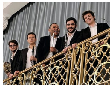
Basilea Wind Quintet.